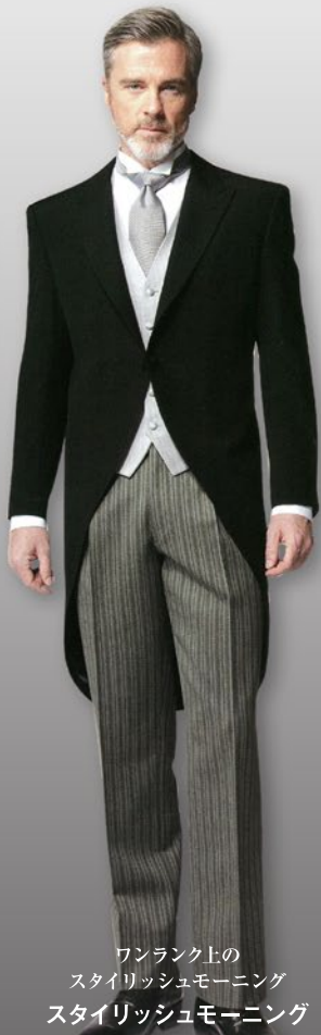
ワンランク上の スタイリッシュモーニング スタイリッシュモーニング