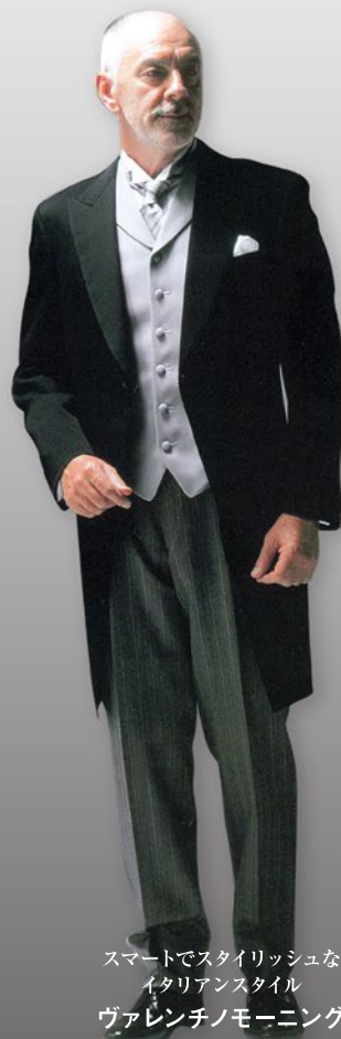
スマートでスタイリッシュな イタリアンスタイル ヴァレンチノモーニング