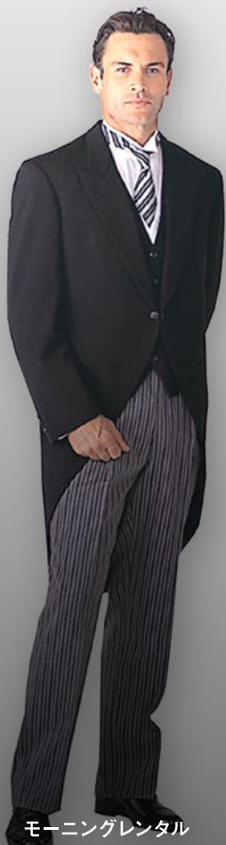
モーニングレンタル